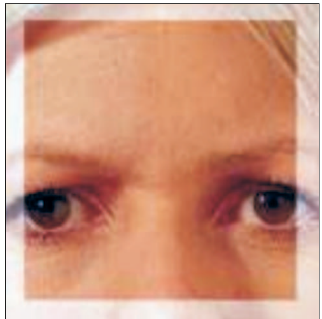
Εικόνα 2 – Ρυτίδες μεσόφρυου.