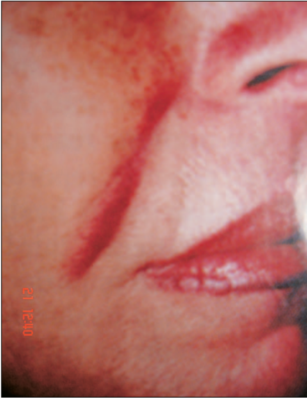
Εικόνα 4 – Ερύθημα και διήθηση στη θέση εμφύτευσης.

λος. Σχετικά με τον μηχανισμό τους φαίνεται ότι εμπλέκονται τα μαστοκύτταρα της περιοχής, μέσω ενός υποδοχέα της κυτταρικής επιφάνειας, του CD44, που εκφράζεται από τα μαστοκύτταρα και θεωρείται ότι είναι υποδοχέας του υαλουρονικού οξέος. 15