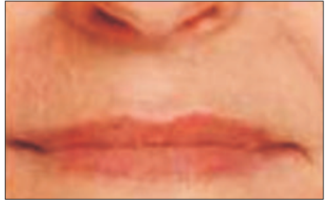
Εικόνα 1 – Ρινοπαραριακές αύλακες.

θωση ρυτίδων διαφορετικού βάθους: Hylaform Fine Line, Hylaform και Hylaform Plus . 9,13