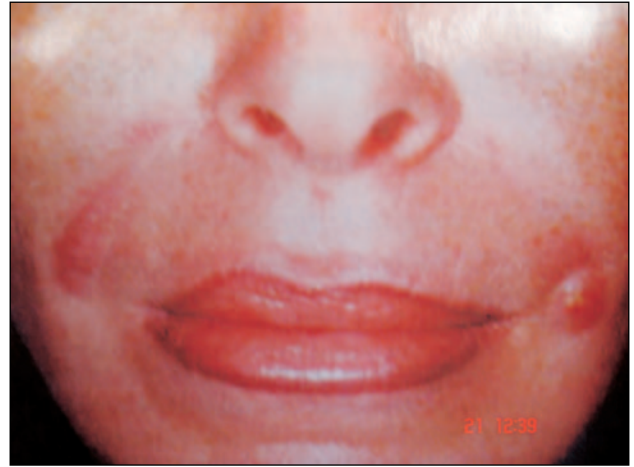
Εικόνα 9 – Κυστικό οζίδιο.

Η παρασκευή του NASHA Gel (Restylane) τροποποιήθηκε από τα τέλη του 1999 προκειμένου να ελαττωθεί η ποσότητα της πρωτεΐνης κατά 6 φορές σε σχέση με την ποσότητα που περιείχε το προηγούμενο προϊόν. Αυτό είχε σαν αποτέλεσμα την ελάττωση της συχνότητας των παρενεργειών κατά 5,9 φορές. 8,15 Η ποσότητα της πρωτεΐνης που περιέχει σήμερα το Restylane (13-17μg/ml) θεωρείται ότι είναι περίπου η ίδια με αυτή που περιέχει το σκεύασμα ζωικής προέλευσης (Hylaform). 8