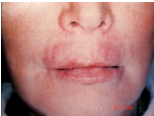
Εικόνα 8 – Όψιμη αντίδραση υπερευαισθησίας.

Έχουν διατυπωθεί διάφορες απόψεις για την παθογένεια των αντιδράσεων υπερευαισθησίας. Φαίνεται ότι οφείλονται σε: 1) Ανοσολογική απόκριση σε μικρές ποσότητες πρωτεΐνης που προκύπτουν από τη διαδικασία της βακτηριακής ζύμωσης (NASHA) ή προστίθενται για να υποβοηθήσουν τη δημιουργία διασταυρούμενων δεσμών (cross-linking) μεταξύ των αλυσίδων του υαλουρονικού οξέος με στόχο την επιμήκυνση του χρόνου ζωής του. Το δεύτερο αφορά και τους 2 τύπους υαλουρονικού οξέος (ζωικής και μη ζωικής προέλευσης). 4,15,25 2) Αντίδραση σε ίχνη ξένων πρωτεϊνών ζωικής προέλευσης (Hylaform - από πουλερικά). 4,25 3) διαδικασία σταθεροποίησης του πρωτογενούς υλικού που τροποποιεί τη δομή του υαλουρονικού οξέος πιθανόν κατά 0,6 έως 1% περίπου, το οποίο μπορεί επίσης να προκαλέσει κάποια αντίδραση. 9