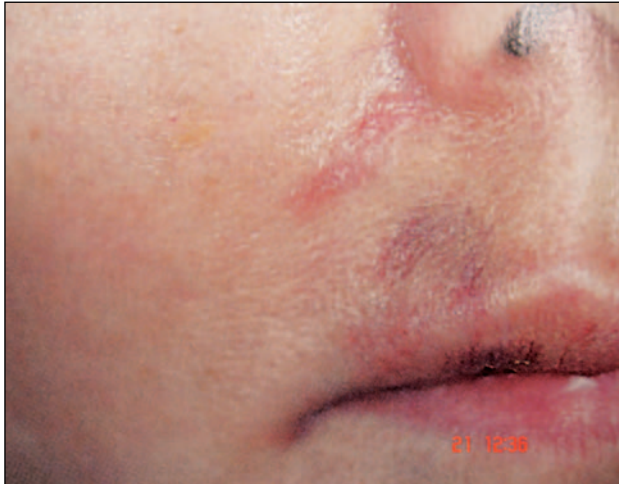
Εικόνα 7 – Όψιμη αντίδραση υπερευαισθησίας.

Έχουν διατυπωθεί διάφορες απόψεις για την παθογένεια των αντιδράσεων υπερευαισθησίας. Φαίνεται ότι οφείλονται σε: 1) Ανοσολογική απόκριση σε μικρές ποσότητες πρωτεΐνης που προκύπτουν από τη διαδικασία της βακτηριακής ζύμωσης (NASHA) ή προστίθενται για να υποβοηθήσουν τη δημιουργία διασταυρούμενων δεσμών (cross-linking) μεταξύ των αλυσίδων του υαλουρονικού οξέος με στόχο την επιμήκυνση του χρόνου ζωής του. Το δεύτερο αφορά και τους 2 τύπους υαλουρονικού οξέος (ζωικής και μη ζωικής προέλευσης). 4,15,25 2) Αντίδραση σε ίχνη ξένων πρωτεϊνών ζωικής προέλευσης (Hylaform - από πουλερικά). 4,25 3) διαδικασία σταθεροποίησης του πρωτογενούς υλικού που τροποποιεί τη δομή του υαλουρονικού οξέος πιθανόν κατά 0,6 έως 1% περίπου, το οποίο μπορεί επίσης να προκαλέσει κάποια αντίδραση. 9