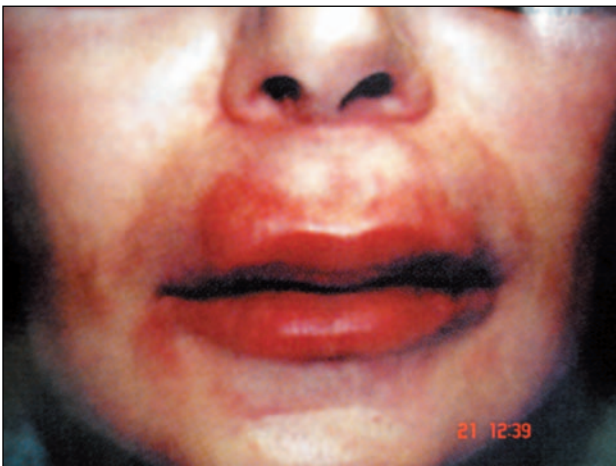
Εικόνα 5 – Παροδικό ερύθημα και οίδημα χειλέων.

Σε μία μελέτη, η ορολογική εξέταση σε άτομα με αλλεργικές αντιδράσεις έδειξε αντισώματα έναντι του Restylane ή/και του Hylaform, καθώς και IgG και IgE αντιυαλουρονικά αντισώματα χωρίς να είναι γνωστή η σημασία τους. 22,23