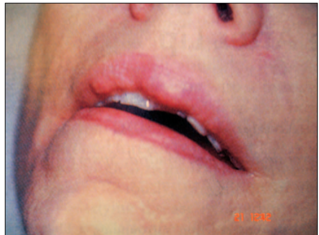
Εικόνα 6 – Οζίδια άνω χείλους.